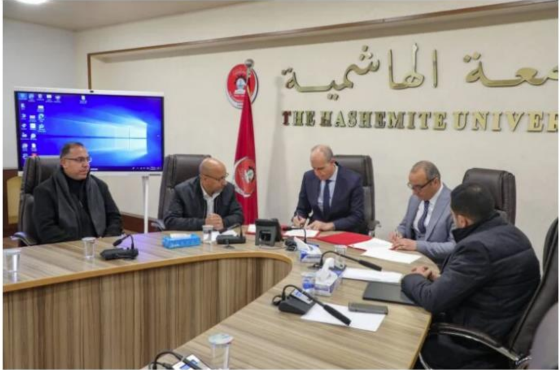
وكالة الجامعة الإخبارية