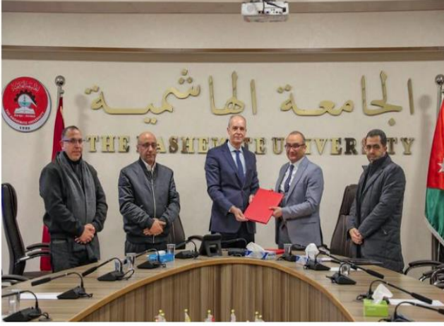
الهاشمية" ومؤسسة الملك الحسين يشرعان في تنفيذ مشروع تعزيز دور الشباب في تنمية المجتمعات